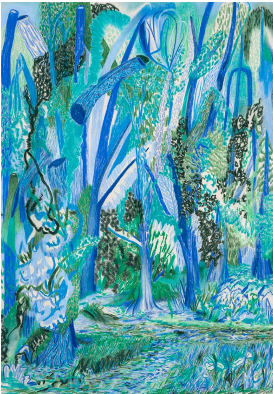
Englische Partie (New Edit) Nr.24 aus der »Hundsburg-Serie« Farbstift und Pastellkreide auf Leinwand 150 x 105 cm | 2021