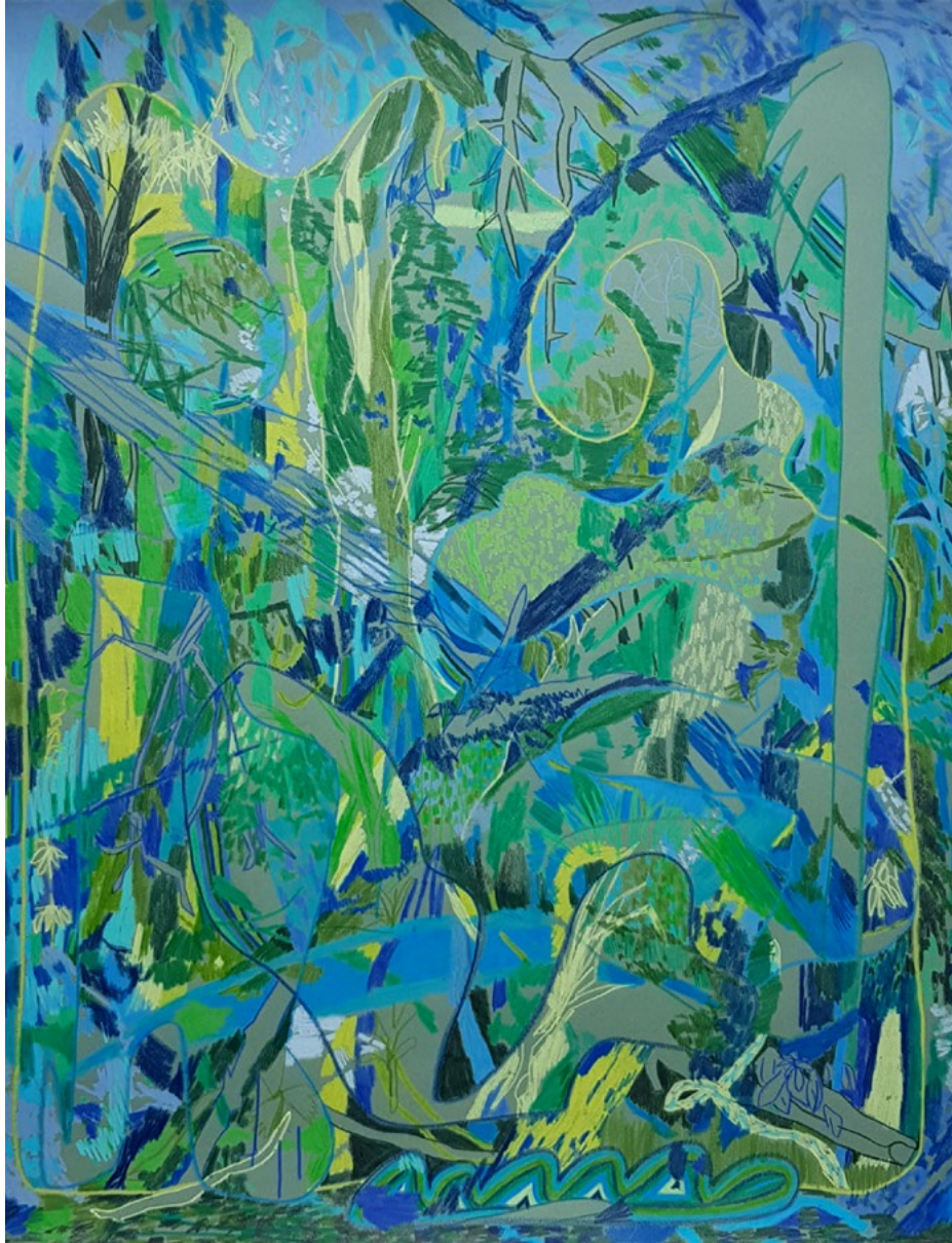
Olive aus der Serie »Kulki« Farbstift auf Papier 65 x 50 cm | 2022