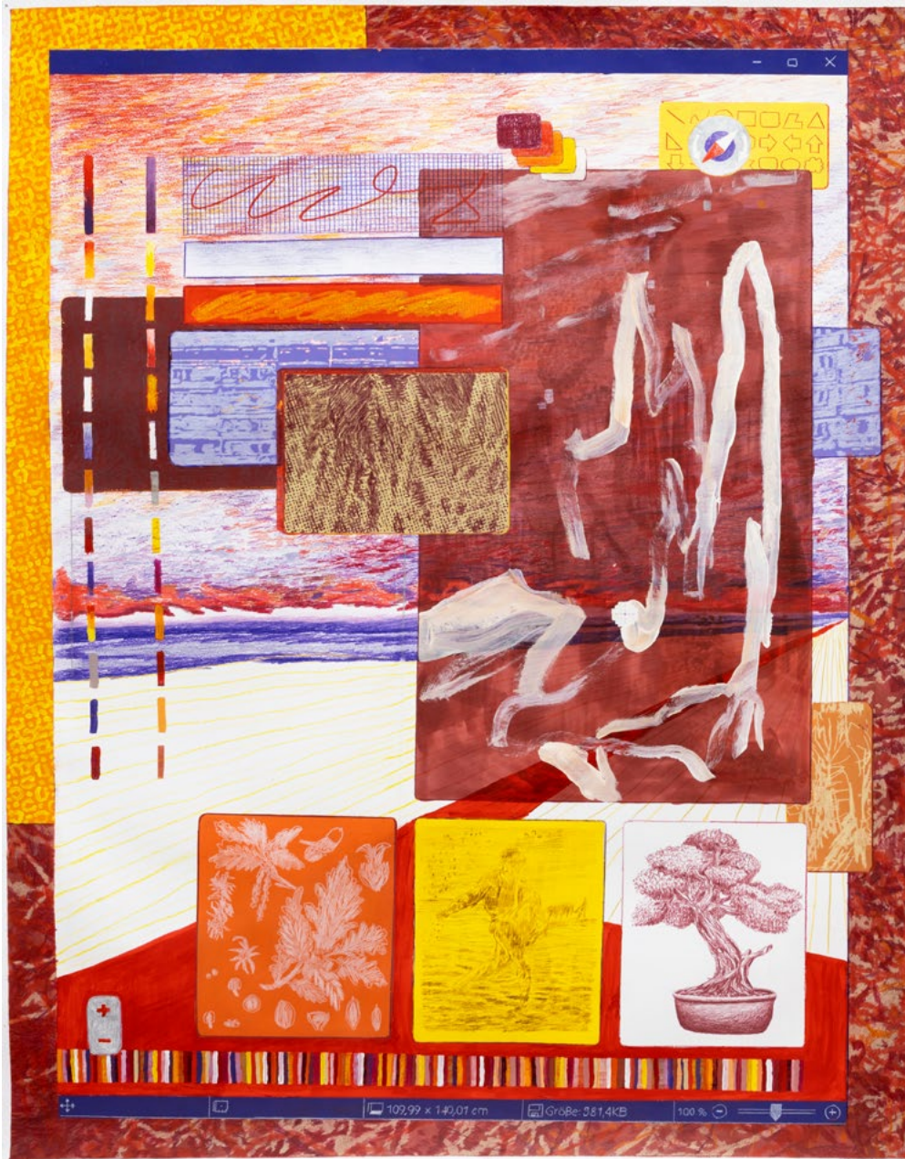
Die Aufzucht Farbstift, Tusche und Acrylfarbe auf Papier 140 x 110 cm | 2022