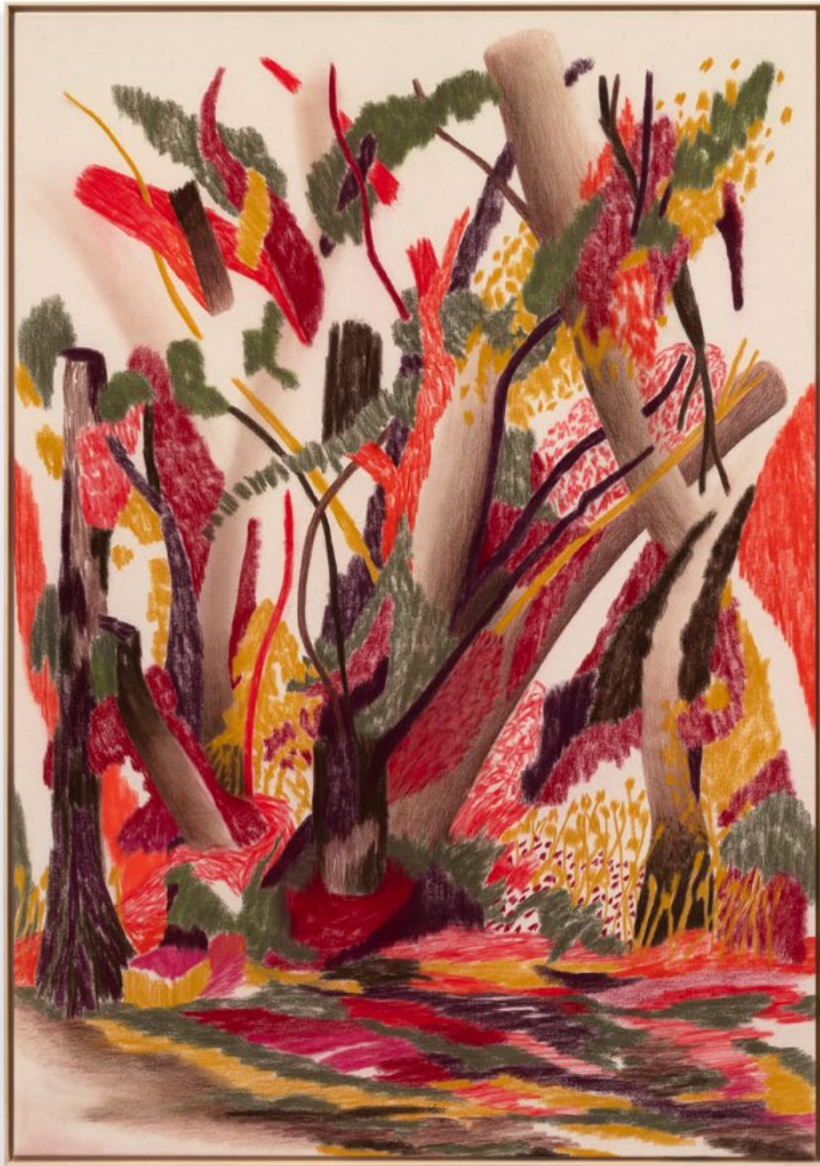
Englische Partie (New Edit) Nr.51 aus der »Hundsburg-Serie« Farbstift und Pastellkreide auf Leinwand 150 x 105 cm | 2020