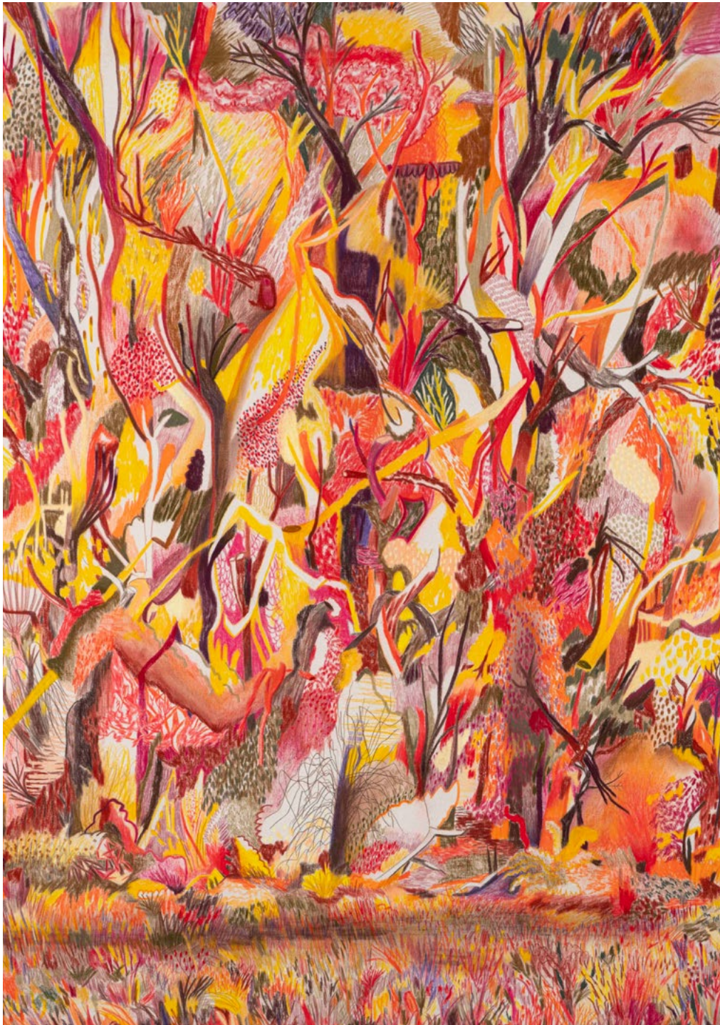
Niedermühlenwiese (New Edit) aus der »Hundsburg-Serie« Farbstift und Pastellkreide auf Leinwand 210 x 150 cm | 2021