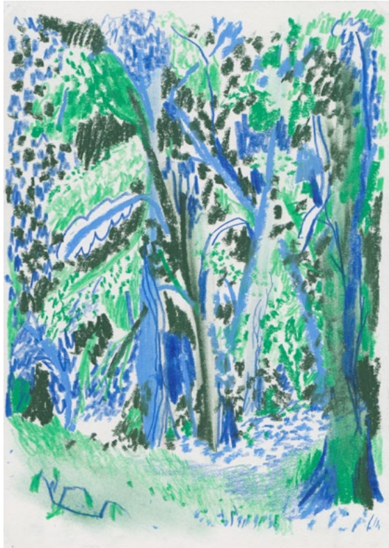
Englische Partie Nr.15 aus der »Hundisburg-Serie« Farbstift und Pastellkreide auf Papier 30 x 21 cm | 2020