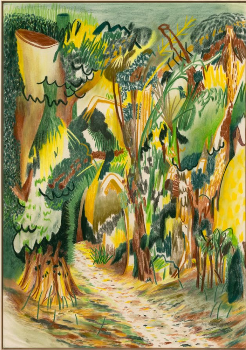
Englische Partie (New Edit) Nr. 14 aus der »Hundisburg-Serie« Farbstift und Pastellkreide auf Leinwand 150 x 105 cm | 2021