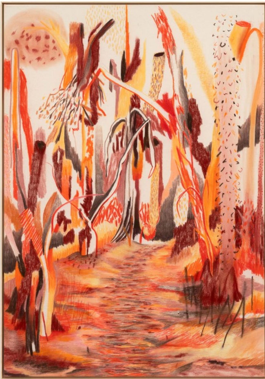
Englische Partie (New Edit) Nr.49 aus der »Hundisburg-Serie« Farbstift und Pastellkreide auf Leinwand 150 x 105 cm | 2021