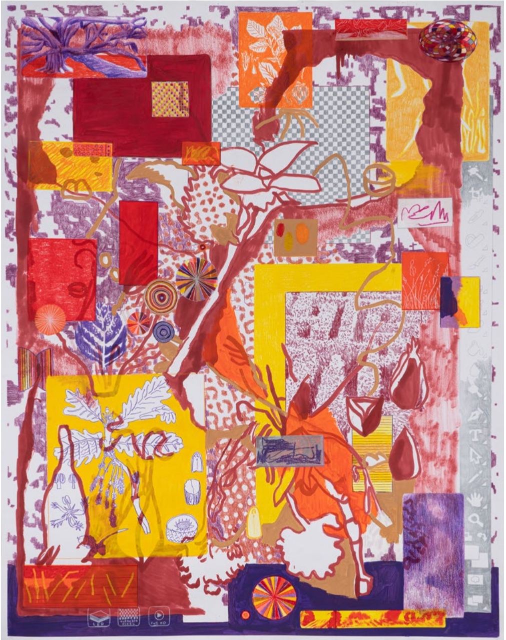
Der Samen Farbstift, Tusche und Acrylfarbe auf Papier 140 x 110 cm | 2022